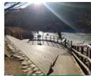
주산지 2 전망대