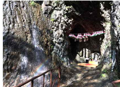
주왕의 님이 깃든 주왕굴과 수달래