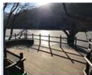
주산지 1 전망대