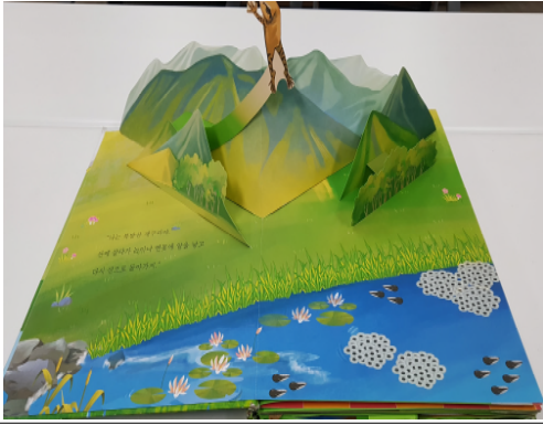
(운영사진_1 북방산 개구리)