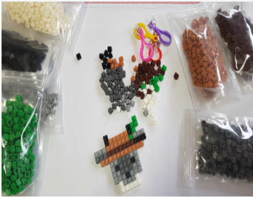
(운영사진 _ 산양 만들기2)