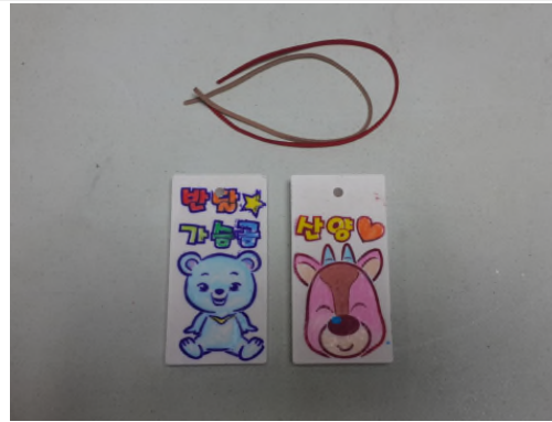
(운영사진_4 석고방향제 완성)