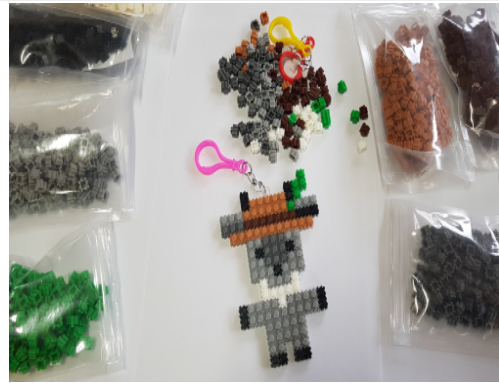
(운영사진 _ 산양 완성3)