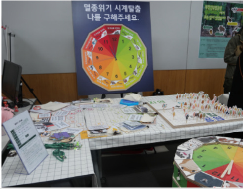
(운영사진_1 멸종위기 시계 탈출1)