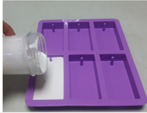
(운영사진_2 석고방향제 만들기)