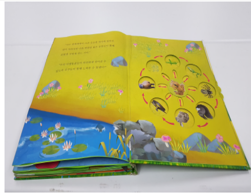
(운영사진_4 개구리 한 살이)