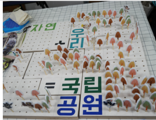
(운영사진_4 멸종위기 시계 탈출 숲 블록)