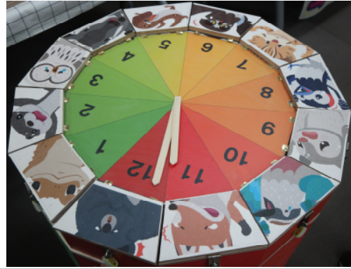
(운영사진_2 멸종위기 시계 탈출2)