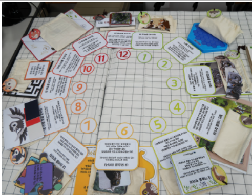
(운영사진_3 멸종위기 시계 탈출 퀴즈)