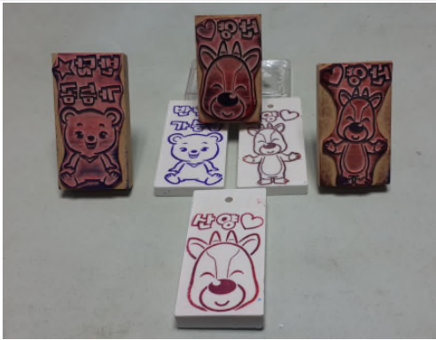
(운영사진_3 동물 스탬프 찍기)