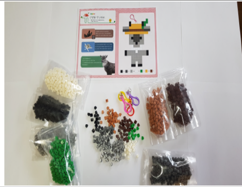
(운영사진 _ 산양 만들기1)