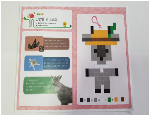
(운영사진 _ 산양도안)