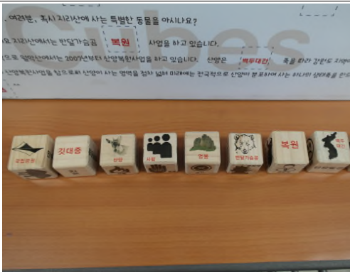
(운영사진_3 주사위에 이미지 부착)