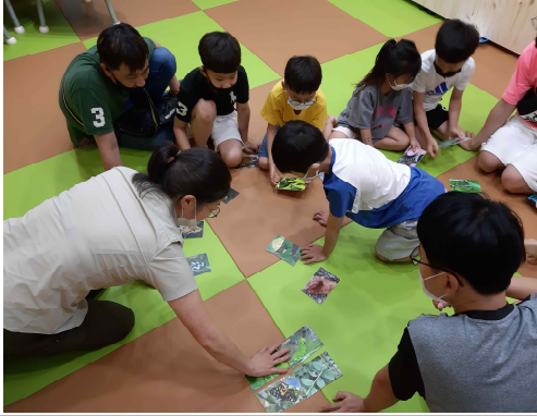
애벌레와 어른벌레를 구분 한다