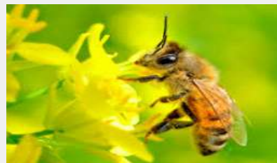
(꿀벌 이야기 및 꿀벌 관찰)