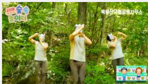
(‘개구리’ 노래에 맞춰 노래 부르기 및 율동)