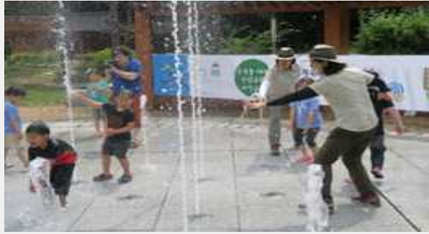
(구천동계곡 또는 다목적광장에서 물놀이)