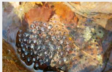
(개구리 알을 찾아 관찰 트레이에 옮겨 관찰)