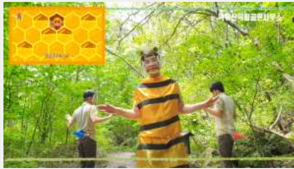
('꿀벌의 비행' 노래에 맞춰 노래 부르기 및 율동)