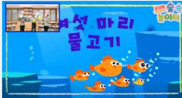
(‘여섯 마리 물고기’ 노래에 맞춰 노래 부르기 및 율동)

이제 우리 몸을 풀어볼까요? 아마 아는 친구들도 있을 것 같아요. '여섯 마리 물고기' 노래에 맞춰 신나게 몸을 흔들며 신나게 춤을 춰 봅시다!