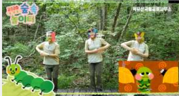
(‘배고픈 애벌레’ 노래에 맞춰 노래 부르기 및 율동)

자~ 이제 신나게 노래 부르고 춤을 춰보도록 하겠습니다. 노래는 '배고픈 애벌레'입니다.