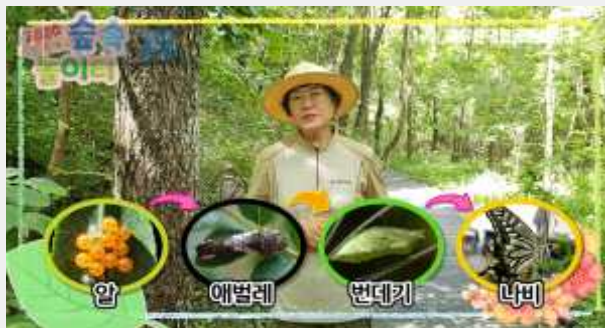
(나비의 탈바꿈 이야기)