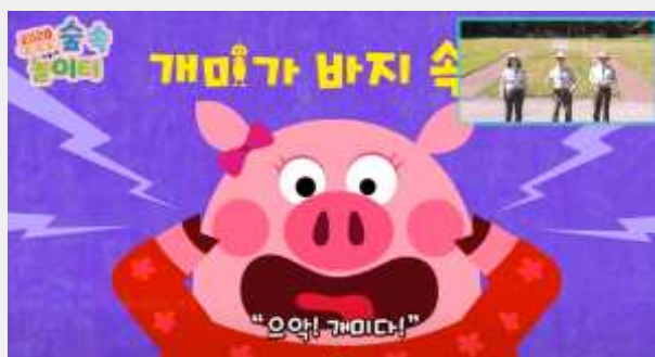
(‘개미가 바지 속에’ 노래에 맞춰 노래 부르기 및 울동)

'개미가 바지 속에'라는 신나는 노래가 나오면 재밌고 신나게 우리 같이 춤을 춰 봐요. 준비되었죠? 큐~!