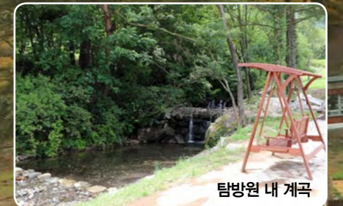
탐방원 내 계곡