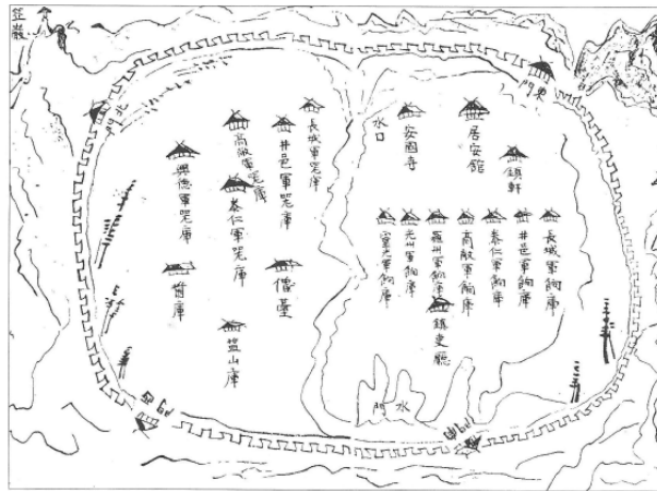
호남읍지 중 입암산성진지도 (성내 시설 및 주요 속현의 군량미, 군기 창고)

이제까지 입암산성의 역사와 전체적인 모습에 대하여 지도를 보면서 설명을 드렸는데요. 그 실제 모습이 너무나 궁금하시죠?(대답 뒤에)