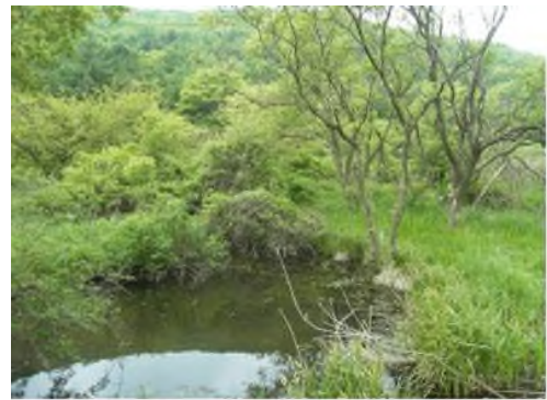
입암산성 습지 내 옛 마을 사진(좌), 현재 입암산성 습지 전경(우)

입암산성 습지에는 다양한 생물들이 살아가고 있습니다. 버드나무와 달뿌리풀을 포함해 69과 136속 159종 29변종 1아종의 식물이 살고 있으며, 붉은배새매, 새매, 소쩍새, 까막딱다구리 등 72종의 조류와 삵, 멧돼지, 고라니 등 6과 7종의 포유류가 살아가고 있는 생태계의 보고입니다. 이외에 다양한 양서류와 곤충류가 서식하며 습지 생태계를 구성하고 있습니다.