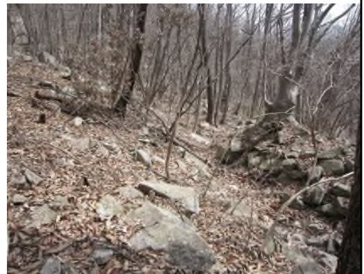
입암산성 초입의 방어시설(좌 : 차단성, 우 : 옹로)