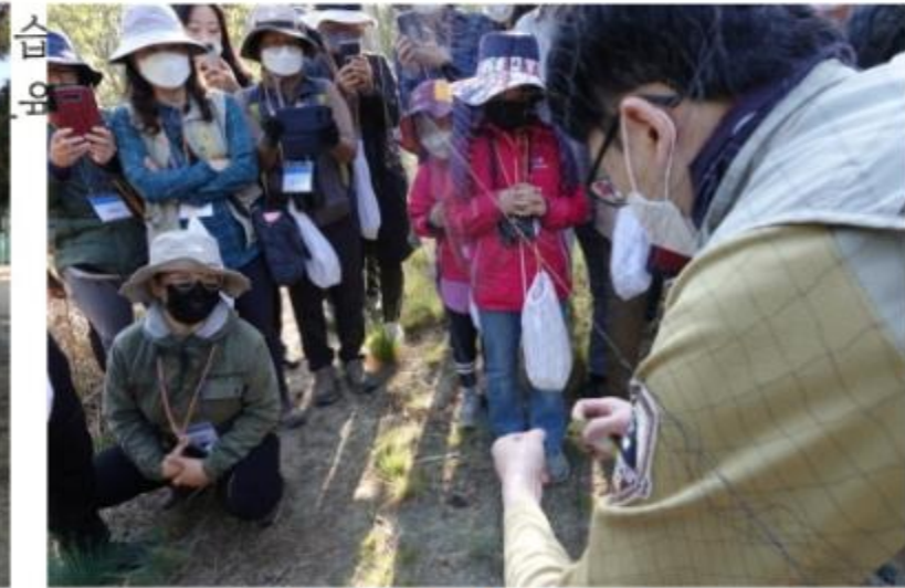
새그물에서 새떼기 교육