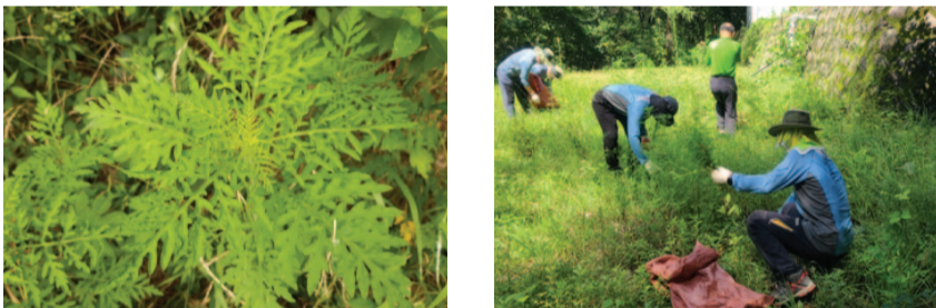
[ 생태계 교란식물(돼지풀)과 제거하는 모습 ]

주왕산국립공원사무소 직원과 자원봉사자 등이 참여한 가운데 생태계 교란식물 제거를 통해 공원 내 외래식물 확산을 예방하고 생물다양성 보전에 힘쓰고 있습니다. 상의 및 절골지구 돼지풀 집단 서식지를 대상으로 뿌리째 뽑기, 예초작업을 통해 총 8,000㎡ 면적의 돼지풀을 제거하였습니다