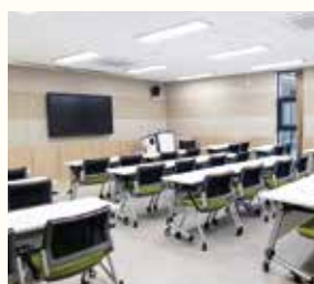
강의실 (국망봉 / 연화봉)