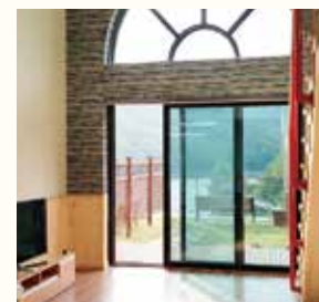
생활실 (일반실 / 복층실) 6인 : 108~111 / 201~206