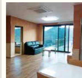
생활실 8인 : 207~208