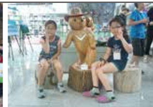
미래세대 청소년 지원