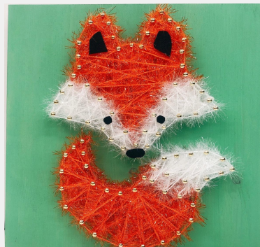
⑥ 펠트지로 눈코귀를 붙이면 "붉은여우" 완성