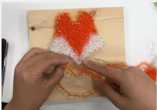
⑤시작점에 매듭을 짓고 면을 채워준다.