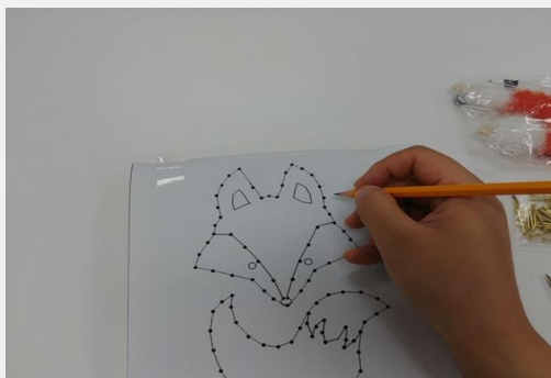
③못의 위치를 연필로 표시한다.