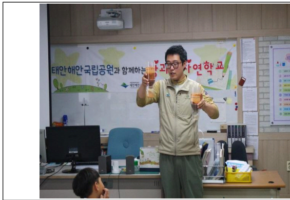
방과 후 학교 중 운영