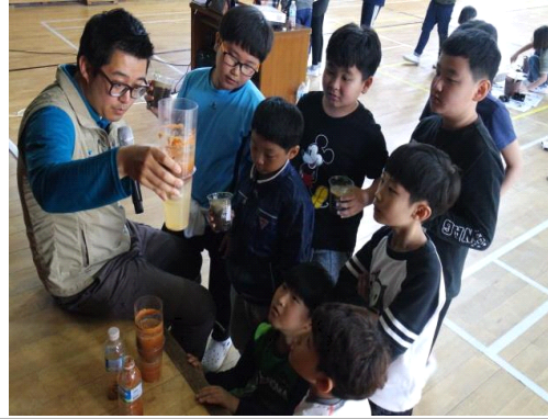
방과 후 학교 중 운영