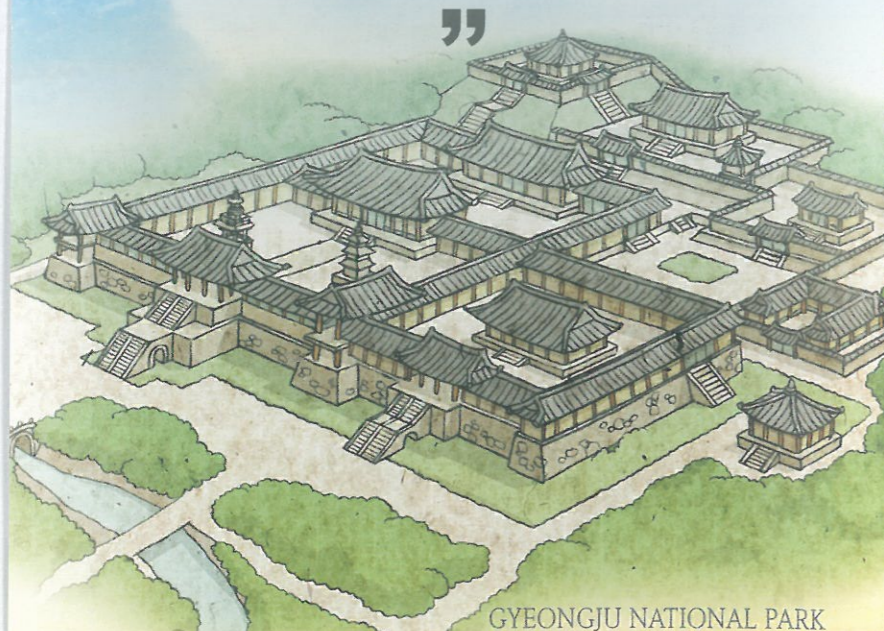
GYEONGJU NATIONAL PARK

21곳의 국립공원 중 1968년 지리산국립공원에 이어 두 번째로 지정되었고 우리나라에서 유일한 사적형 공원으로 분류되어 있습니다. 역사와 자연이 함께 어우러진 경주국립공원은 불국사, 석굴암을 품에 안은 토함산과 노천박물관으로 불리는 남산을 비롯한 8개 지구로 이루어져 있습니다.